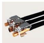
Nejširší rozsah průřezů vodičů v oboru